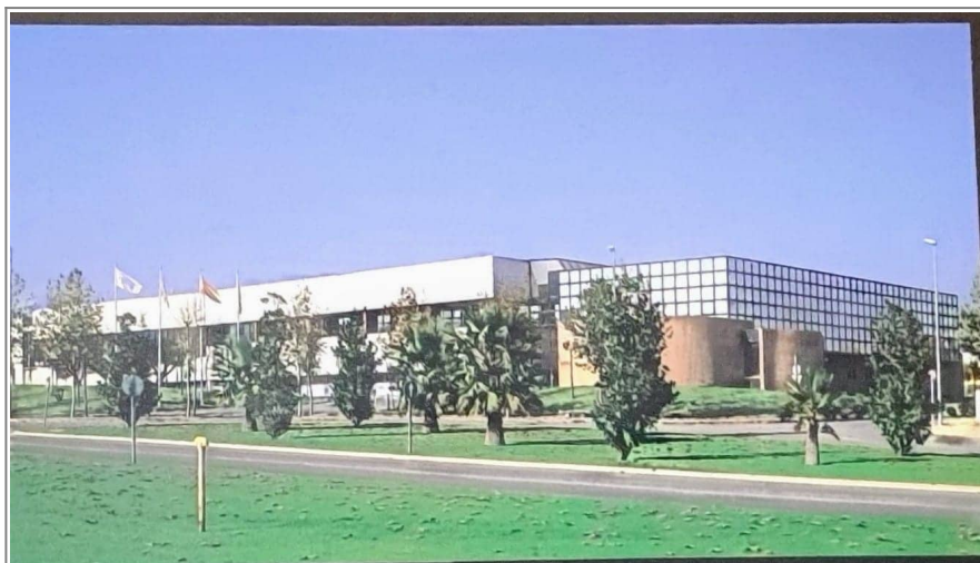
Fábrica de Comelta en los 90

Un año más tarde, para incrementar su expansión internacional, Comelta se fusiona con múltiples empresas tecnológicas españolas, convirtiéndose en la empresa más grande del sector informático en España. En este momento Comelta ya estaba operando en España, Portugal, Francia y Alemania. Por desgracia, cuando todo parecía ir viento en popa, en 1992 Europa entra en recesión, resultando en un brusco descenso de ventas que condenó la empresa, que acabaría entrando en suspensión de pagos en Diciembre. Por suerte, en 1993 el Banco Central Hispano rescata la compañía y esta puede seguir operando.