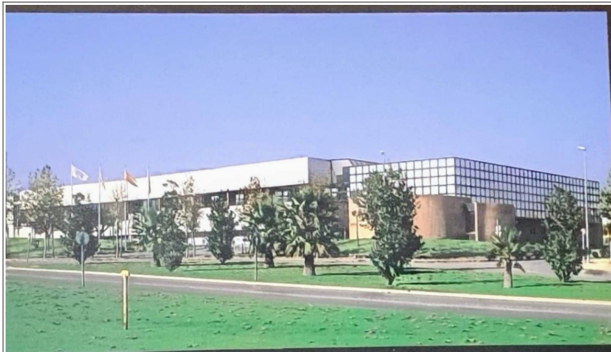
Fábrica de Comelta en los 90

Publicidad del Computec S/1 (Ordenador Personal nº22, 1984)