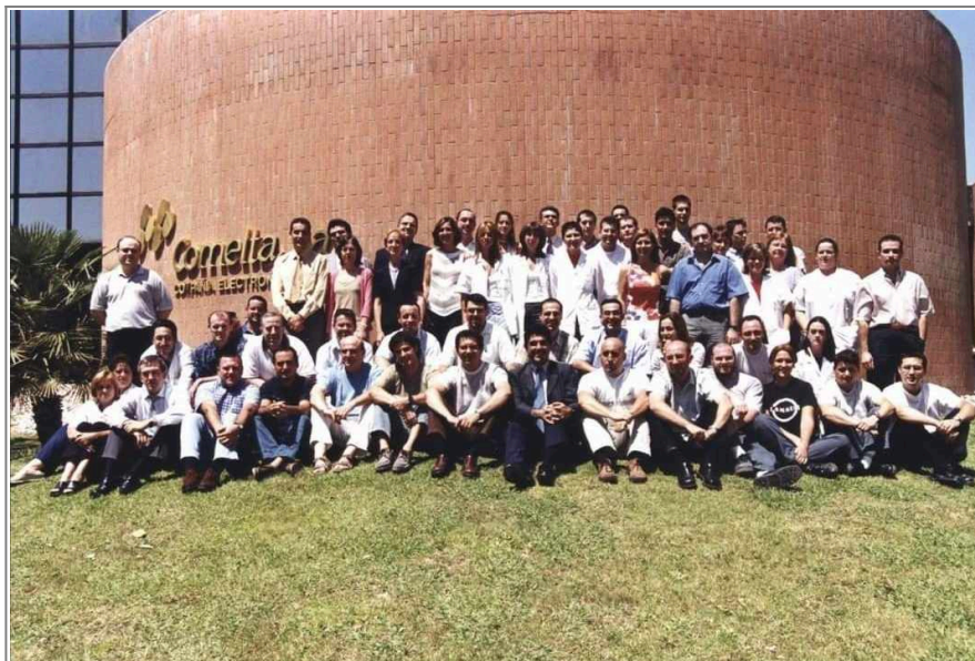
Foto de la Plantilla de Comelta antes de la venta a Odeco

Por desgracia este grupo empresarial acaba siendo un fracaso, registrando pérdidas millonarias para mayo de 2002, entrando en octubre de este año en suspensión de pagos, lo que resulta en la venta de la división de informática de Comelta a Data Logic, dueña de la cadena de tiendas BEEP, pasando esta a llamarse Comelta Barebone. Poco después se vendería el resto de Comelta a Odeco por 4,2 Millones de euros. A partir de aquí comelta se dedicó al contract manufacturing hasta 2004, cuando la compañía perdió la fábrica del Parque Tecnológico debido a desacuerdos en cuanto a la compra de la antigua factoría. En 2006 un fondo de accionistas compra Odeco y crea el grupo Imago, desapareciendo en algún momento entre 2007 y 2008 toda referencia a Comelta, siendo esta finalmente absorbida por el grupo Imago. En cuanto a Comelta Barebone, la división que fue comprada por Data Logic, siguió operando hasta 2014.