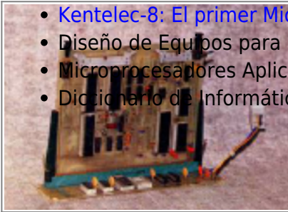
Placa que contenía la memoria y la CPU (Mundo Electrónico, 1975 (Archivado por Old8Bits ))